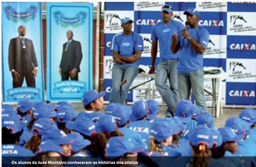
Os alunos da Juan Montalvo conheceram as histórias dos atletas