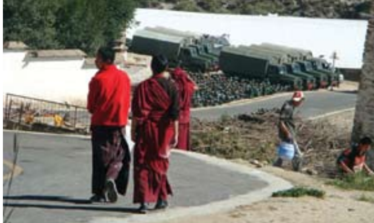
Tropas no Monastério de Drepung, em Lhasa

O caminho do meio – Os protestos de março deste ano parecem reacender uma postura de enfrentamento entre os tibetanos, um com-