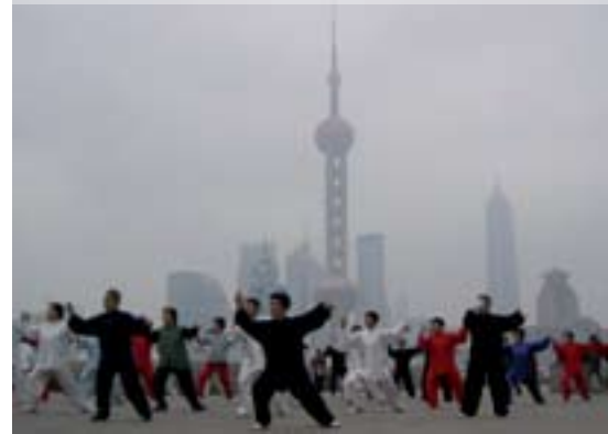
Em Shangai, o tai chi chuan é praticado ao ar livre

é que começam as aplicações externas. Os movimentos geralmente são executados de forma lenta, embora alguns também incluam ações repentinamente explosivas, como o i-chuan , hsing-i chuan , tai chi chuan estilo chen e pa-kua .