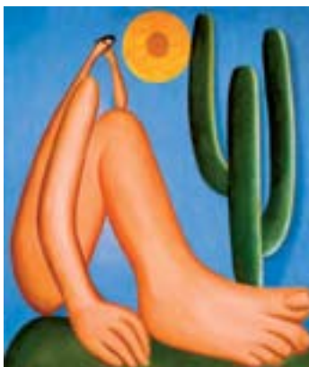
Abaporu , de Tarsila do Amaral, 11 jan.1928. Óleo sobre tela: 85cm x 73cm. (Leia sobre Tarsila na página 5 desta edição)