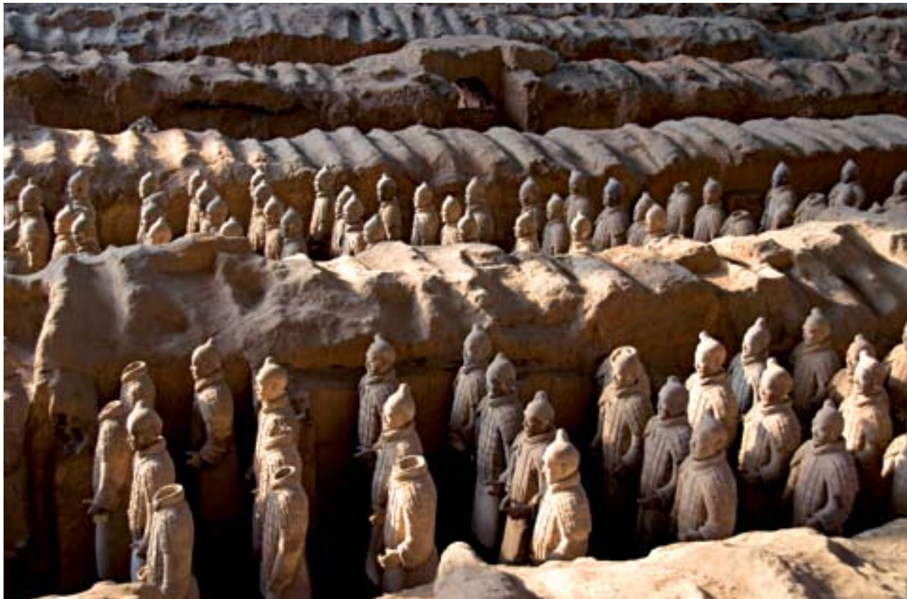
Os incríveis guerreiros em terracota descobertos em Xian imortalizaram a história de lutas da região até a unificação da China

Lutas chinesas preservam tradição que as tornam especiais: filosofia oriental, defesa e meditação