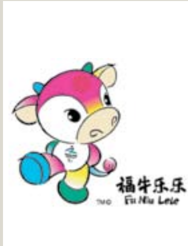
Mascote das Paraolimpíadas

expectativa de medalhas nos Jogos, que deverá ter um aumento sobre o número conquistado na última Paraolimpíada. O Brasil terminou os Jogos Paraolímpicos de Atenas na 14ª posição geral no ranking de medalhas, melhorando 10 posições em relação a Sidney.