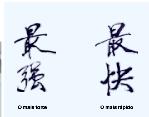
Chang Ta produzindo os ideogramas

– Desde 1896, foram disputadas 25 edições dos Jogos, sendo que a última foi realizada novamente na capital grega em 2004. Mesmo sendo fruto de um ideal de paz e unidade entre os ►