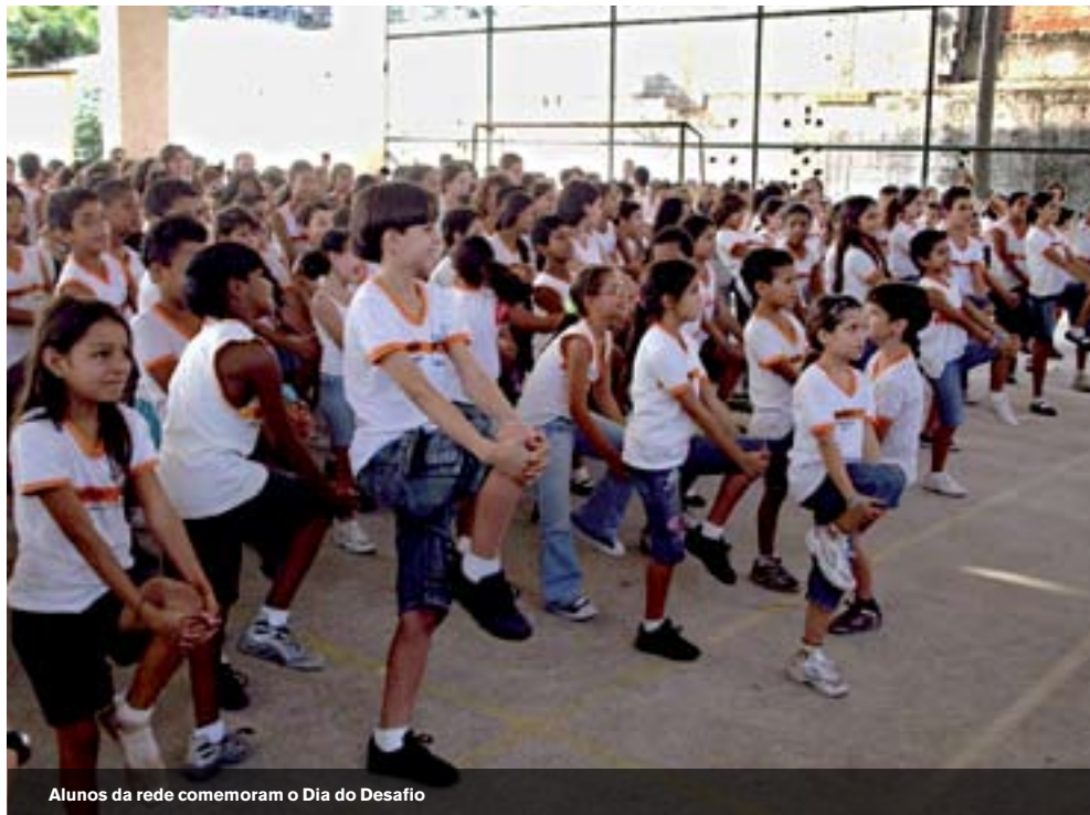
Alunos da rede comemoram o Dia do Desafio