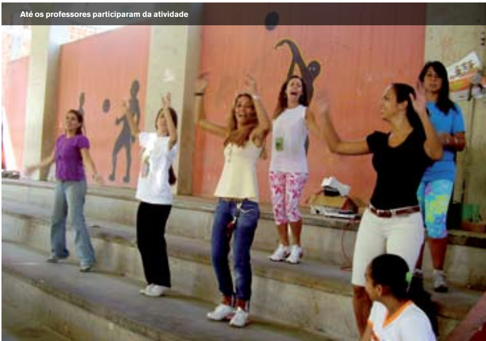
Até os professores participaram da atividade