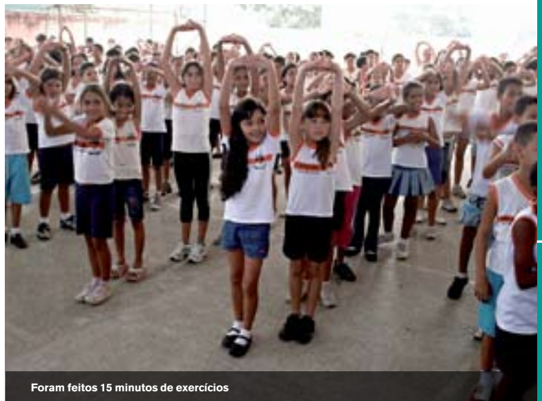
Foram feitos 15 minutos de exercícios

Mais de 3 mil cidades em 22 países participaram do Dia Mundial do Desafio este ano. No Brasil, cerca de 1.500 municípios promoveram atividades físicas para mostrar às pessoas que um pequeno esforço de 15 minutos diários ►