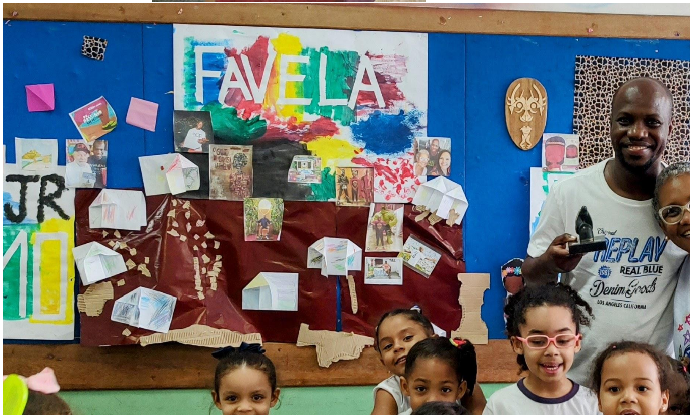
Chico rei – a história do rei Galanga